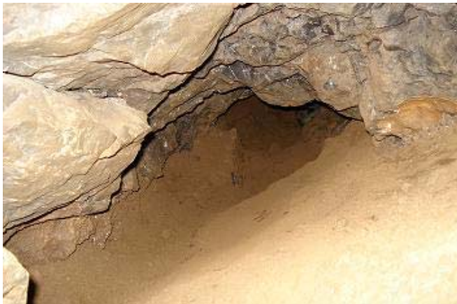
Onze Nieuwe Highway =3 dagen werk

Maar het goede nieuws is dat we nu een ruimte zien waar je wel in geraakt en je kunt draaien met een mogelijk vervolg naar rechts. Maar door die verdorpe lamel kan je net niet zien of het een gang is die vertrekt of dat het een zwart gat tussen de blokken is. Maar