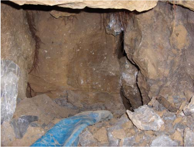
De onstabiele zone boven

en werkten we beneden verder. Na enkele verhuissessies van stenen konden we eindelijk in een klein vervolgtje kruipen, een zaaltje(?) van zo'n 2m lang met toch wel enkel concreties. Deze werden meteen op de gevoelige plaat vastgelegd (ik had een nieuw fotoestelletje gekregen voor de kerst en wilde dit eens uitproberen). Echt groot is het hier niet, en het vervolg is niet evident. Je hebt een spleet naar links, een naar rechts en ik geloof dat je naar beneden ook nog kunt werken. Het zal niet simpel zijn om nog met je puin weg te geraken, er is nog een beetje plaats in het putje vlak voor de kruipgang. Maar ook echt niet veel meer. Het is heel belangrijk denk ik om eerst een wat koudere periode af te wachten (als die nog gaat komen natuurlijk) om dan eens goed rond te neuzen met de wierook. Wij hebben niet goed kunnen vaststellen vanwaar de tocht nu eigenlijk komt.