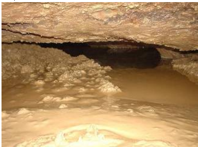
Onze Graafplaats : Siphon Merde