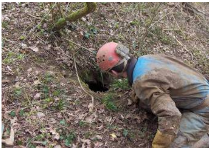
Maagdelijk terrein : Welva II

punt dat echt te smal is, hier zullen later wat moeten verbreden. Zonder veel werk kunnen we in dat putje en dan aan het water te geraken. Enfin we houden het voor bekeken en nadat we de ingang hebben gecamoufleerd vertrekken we richting auto.