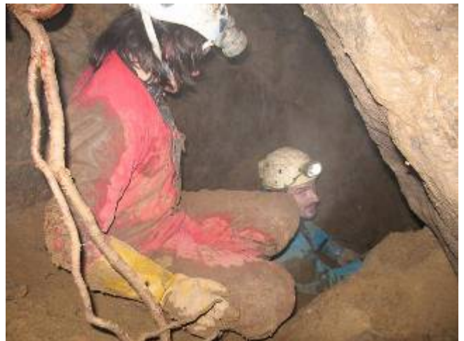
Joepie, een zaaltje voor 3

Terug aan het eerste gat beginnen we, na er eens in geschenen te hebben, aan de desob. Want ons licht gaf toch wel een hoopvol penetrabel zicht. Ik ontferm me over deze zware taak en na 5 minuten hou ik voor bekeken en zit ik mijn helm op. P&A zeggen dat ik toch wat optimistisch ben en ik denk "ik zal ze eens wat laten zien". Ik laat me in de opening zakken en zonder probleem gaat mijn bekken erdoor, de rest volgt een beetje later. Ik land op een puinkegel die de top vormt van een éboulis. Langs beide kanten loopt het verder maar je kan er maar langs 1 kant af. Ik laat me verder zakken en kom zowaar in een zaaltje uit. Op het diepste punt vallen er wat stenen door een gat en ik hoor die nog zeker 4 meter dieper vallen. Ikzelf zit dan al op -4/-5, al een pak onder het niveau van de rivier.