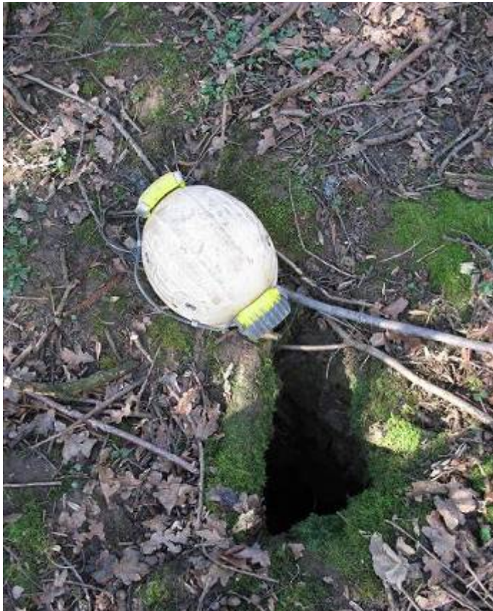
Welva I : Zoals we de grot gevonden hebben

Na deze interessante middag, slaan we de uitnodiging om nu al iets te gaan drinken af omdat we eigenlijk nog een beetje op onze spelehonger zijn blijven zitten. En