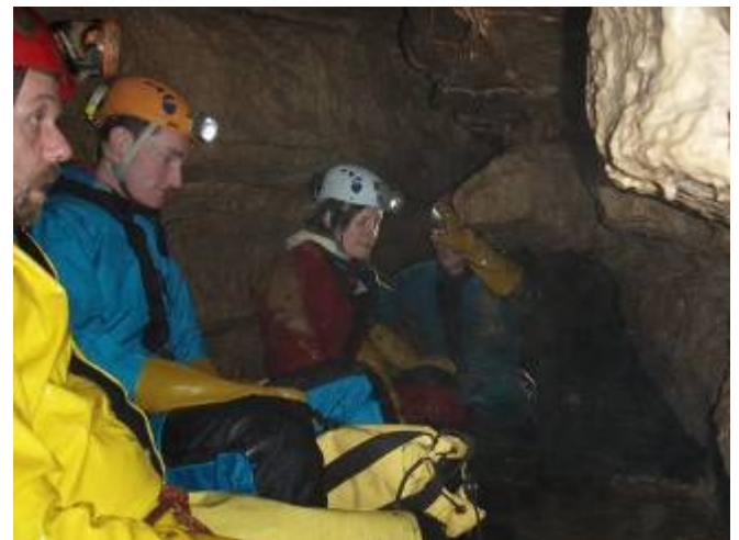
Een Zen-moment ?

Onze knieën waren blauw, we waren uitgedroogd, die bovenste gang was idioot maar de rest van de grot was toch wel goed geweest en we hadden ons goed geamuseerd. Als opwarmertje kon het wel tellen. Een eerste geslaagde dag!