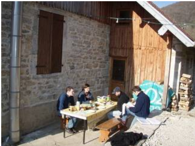
Ontbijt op het terras in Februari !!!