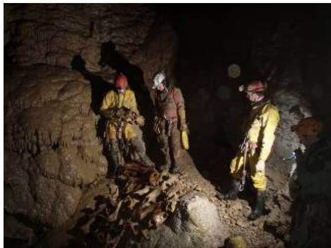
A Pile of Bones

's Nachts komen drie Parijzenaars de andere slaapkamer van de gîte bezetten, heel stilltjes en discreet.