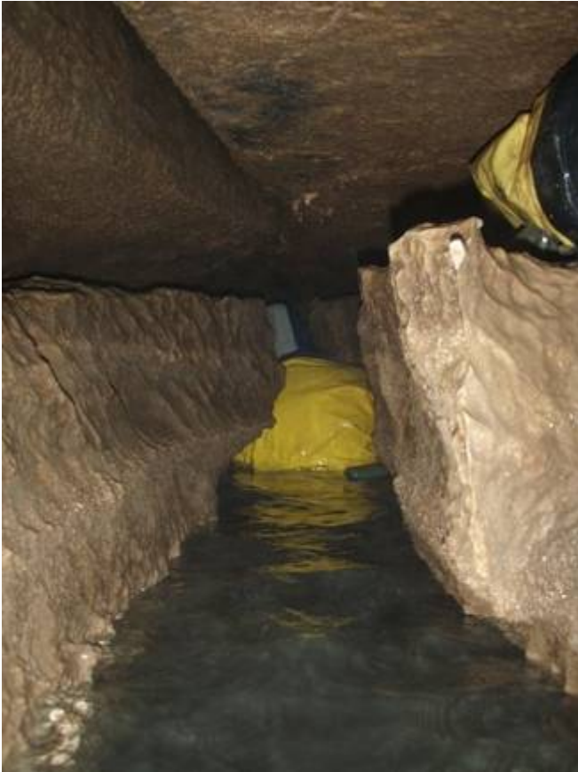
De waterrijke ingangzone