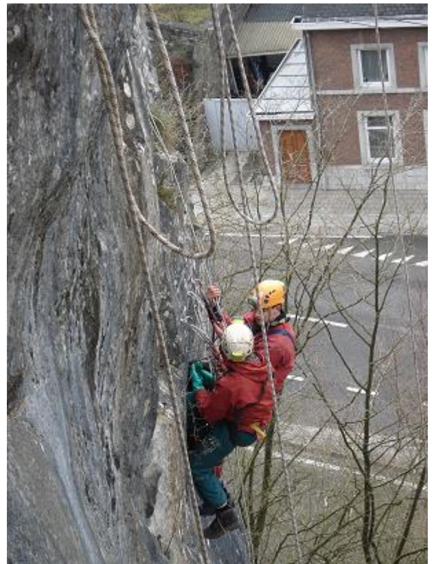
's Avonds aan de rotsen