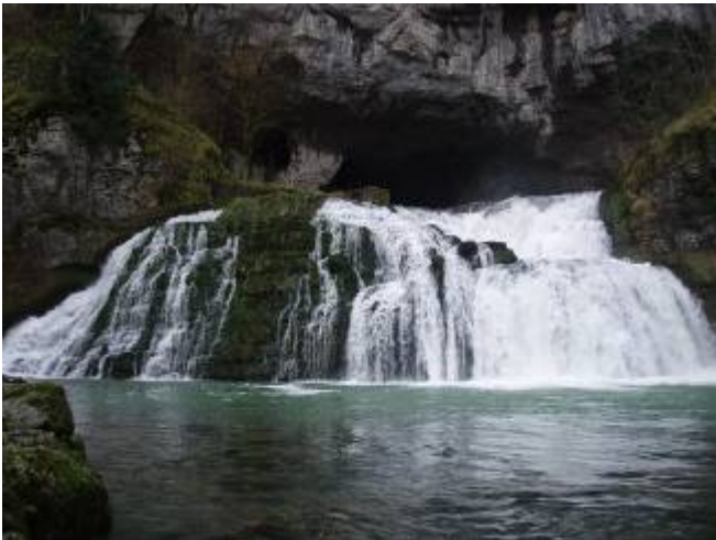
Een mooie afsluiter