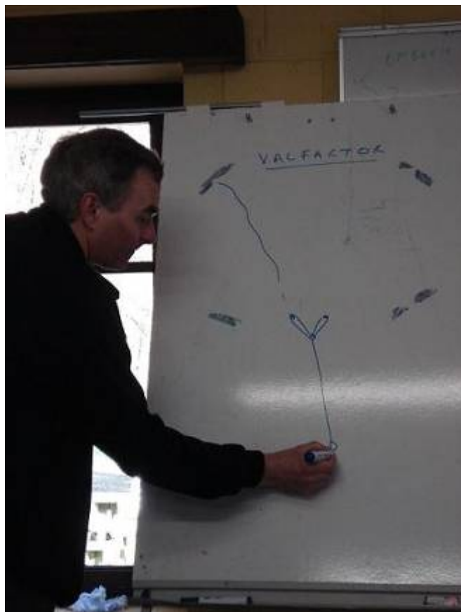
Valfactor, hoe was dat nu al weer ?