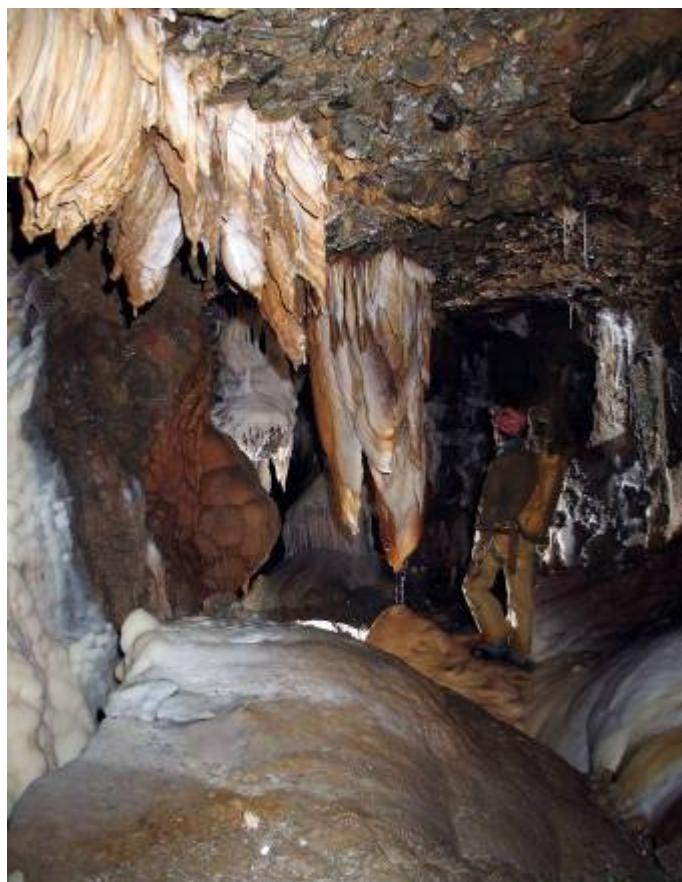
In de Vent d'Ange

Het ingangdeel van de grot is nu een formaliteit geworden, Stocche en Co hebben er een autostrade van gemaakt. Binnen de 10 minuten hebben we dat blokkenstort doorkruist en staan we bovenaan de grote zaal. Vele scotchlites wijzen de weg. Het gaat steil omlaag, en rond -60 ontmoetten we reeds magnifieke aragonietformaties. Rond -90 geeft een klein putje toegang tot het riviertje dat in een zeer mooi geconcretioneerde meander zijn weg omlaag zoekt. Volgen maar en genieten. Na een mooie P15 (de diepste van de grot!) komen we op -180 m aan de afslag waar we vorig jaar onze ontdekkingstocht begonnen. De gevaarlijke overstap is nu voorzien van een looplijn. Alle mooie hoekjes zijn correct met dunne touwtjes afgebakend (methode Avalon!). We dalen alsmaar verder af, in een oogverblindend decor. Hebben wij dat echt allemaal ontdekt, vorig jaar? Ik toon mijn kameraden de "baguettes de gour", die met duizenden opeengepakt, op ooghoogte hangen. Het schouwspel zorgt voor de nodige kreten van bewondering, inderdaad dit is echt uniek.