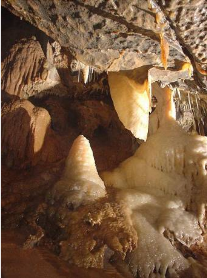
Misschien wel het mooiste hoekje tot nu toe gevonden