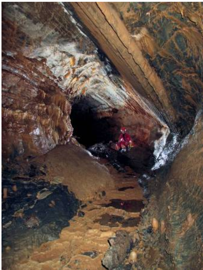
In de Source de Rautely