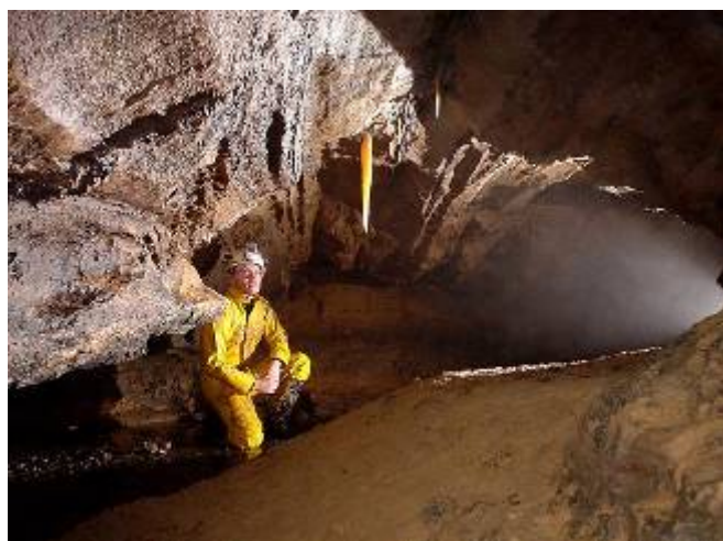
La Solitaire : Een prachtconcretie