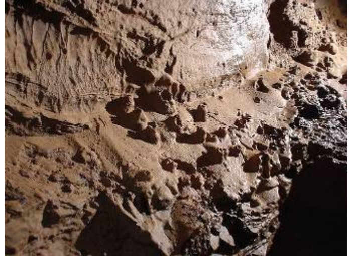
Zeer fragiele kleiformaties