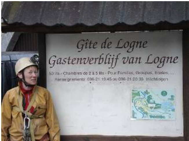
Een beetje reclame voor de Gîte mag altijd

Het tweede weekend voor de brevetgangers ging ditmaal door op 24 en 25 maart 2007. Er was afgesproken om 9.00u in de gîte de Logne in Vieuxville. Het zou weer een zeer gevuld programma zijn, in de voormiddag theorielessen en 's namiddags oefeningen aan de RAC ( Roches aux Corneilles) in Bomal.