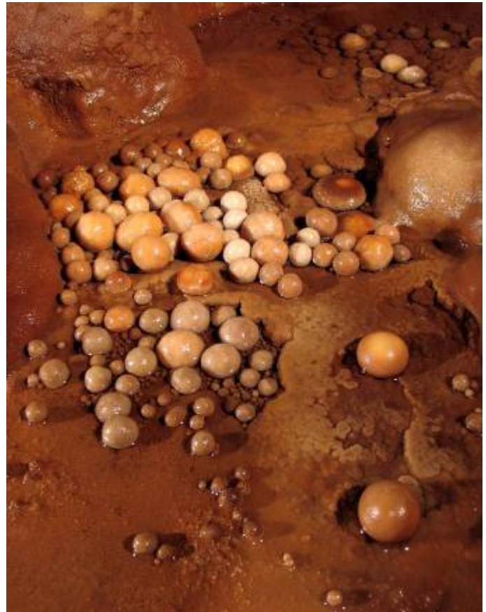
Parel en nog eens parels