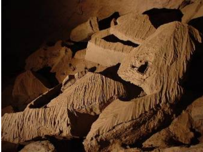
Trou de la Chaise en zijn kleiformaties : uniek in België

We vatten de terugweg aan en de étroitures geven nu veel minder problemen, lang leve de zwaartekracht. Alhoewel in de laatste schuift een deel van mijn kindergeld toch wel in het smalste stuk zeker. Ai, dat doet zeer, maar met buikoefeningen verzet ik het nodige en schuif ik verder naar beneden.