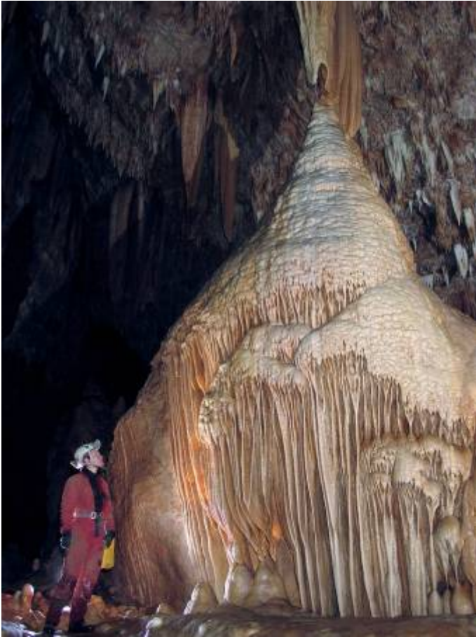
Magnifieke formatie in de Aven des Perles

dat het om een klein grotje ging, met parels uiteraard, maar gauw blijkt dat er een heel grote zaal is die overdadig geconcretioneerd is en kan wedijveren met de mooiste stukken van een Réseau Lachambre of Orgnac. En dat alles zeer goed bewaard, alles is nog flonkerend wit. Enorme witte coulées contrasteren met okerrode rots. Alles glinstert en glanst van het overal druppelende water.