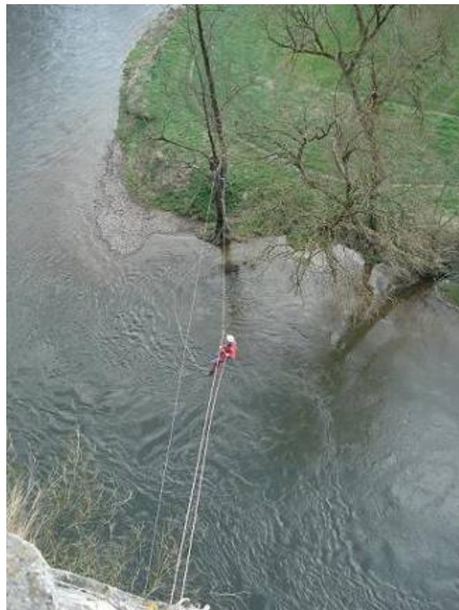
De tyroliene : sensatie troef.

Ook hier hebben we weer heel wat bijgeleerd.