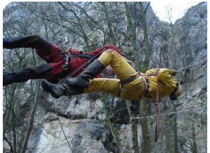
Mich hangt de clown uit met iemand van de secours.

Ook hier had ik geen enkel probleem, alles verliep tot nu toe nog vlotjes. Tot ik natuurlijk weer eens de clown moest uithangen. Ik wist dus dat ik een paraplu zonder problemen kon passeren als ik alles deed volgens de regels, dus niet te diep zakken. Maar wat als je nu per ongeluk toch tot in de lus bent gezakt? Tja, dat zou ik nu eens uitproberen sé. Na een kwartier zotte kuren uithalen, ondersteboven hangen en vloeken heb ik het maar opgegeven want het fluitsignaal was al geweest om te wisselen van stelling. Ze zijn me er dan maar komen afhalen en met een rode kop van schaamte ben ik met mijn staart tussen mijn benen vertrokken naar de derde stelling.