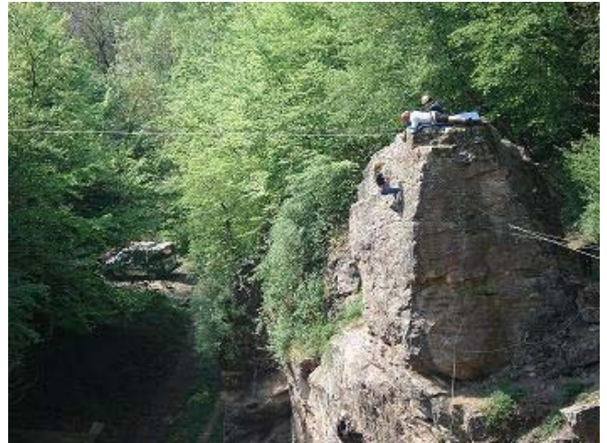
Een fantastische tyrolienne !

Klimmen, afdalen, fractioneren, tyroliennes, hors crue's en paraplu's werden gepasseerd alsof ons leven ervan afhing. Iedereen deed zijn uiterste best en wilde het hele parcours gedaan krijgen.