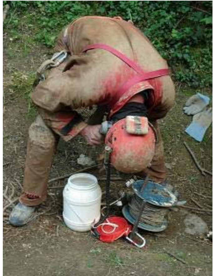
De telefoonverbinding wordt getest : Allo, Allo

Intussen zijn er al verschillende teams bezig om op alle niveaus de voorbereidingen te treffen om die takeloperatie te kunnen uitvoeren. Even later wordt mijn voet terug in de opengesneden neopreensok en dito laars gezet en dan stevig ingetaped zodat de enkel al redelijk geïmmobiliseerd is en daarna wordt het opblaasbaar steunverband om mijn onderbeen vastgemaakt en stevig opgepompt. Dan wordt het weer even wachten tot we het sein krijgen van boven dat ze klaar zijn om te beginnen takelen.