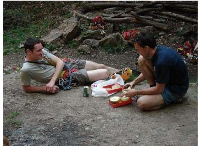
Verbroedering troef op Brevet A

De "die hards" zijn nog opgebleven tot 3.30u. Dat zou zeer doen morgenvroeg!