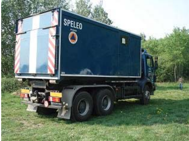
Zwaar materiaal van de Secours