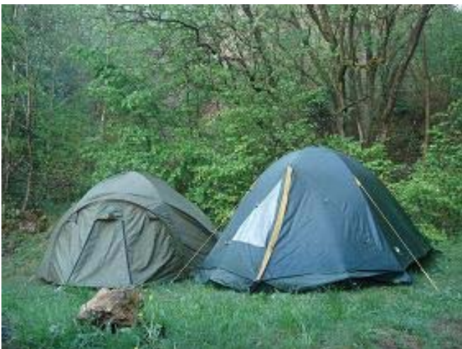
Opdracht volbracht : Alle tenten staan recht

Ondertussen probeerden we toch al een klein vuurtje te maken voor onze barbecue. Gelukkig konden we dit onder een afdak doen waarboven een schouw was voorzien, dus de druppels hadden geen kans om de