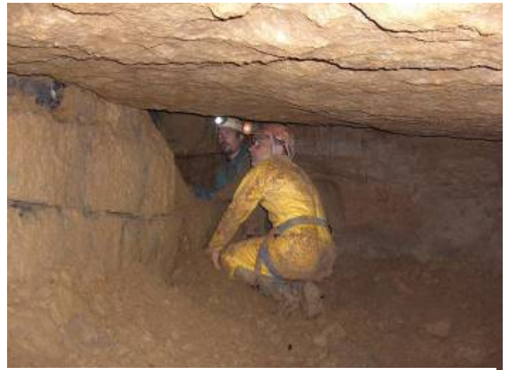
Halfweg de salle Hervé.

Wat doen we, graven of wachten tot de volgende keer zodat er ook anderen van de club kunnen meegenieten? We kiezen voor het laatste en beslissen alles nog eens goed te bekijken op de terugweg. We vinden nog een mogelijk vervolg tussen de blokken waar we enkele meters in kunnen afdalen, te onthouden voor wanneer de andere plek niets geeft. Ook hier komt er goede tocht van beneden maar een desob hier is niet eenvoudig.