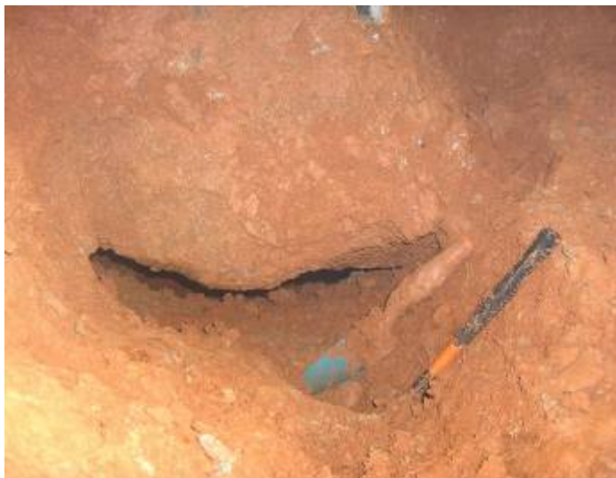
De passage Gardena voor het doorgraven.

De grote legerschap komt uit de kit en we dumpen nu de klei in het gat dat we deze morgen hebben gegraven, Niets geen bakken trekken meer, gedaan daar mee dat moet hier vooruit gaan dat was ons motto.