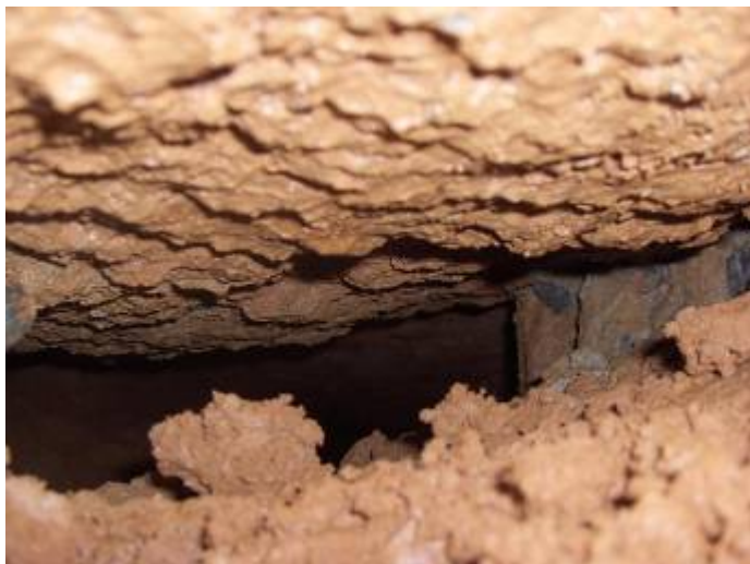
Het vervolg lonkt, we zien 4 meter ver.

De grote legerschap komt uit de kit en we dumpen nu de klei in het gat dat we deze morgen hebben gegraven, Niets geen bakken trekken meer, gedaan daar mee dat moet hier vooruit gaan dat was ons motto.