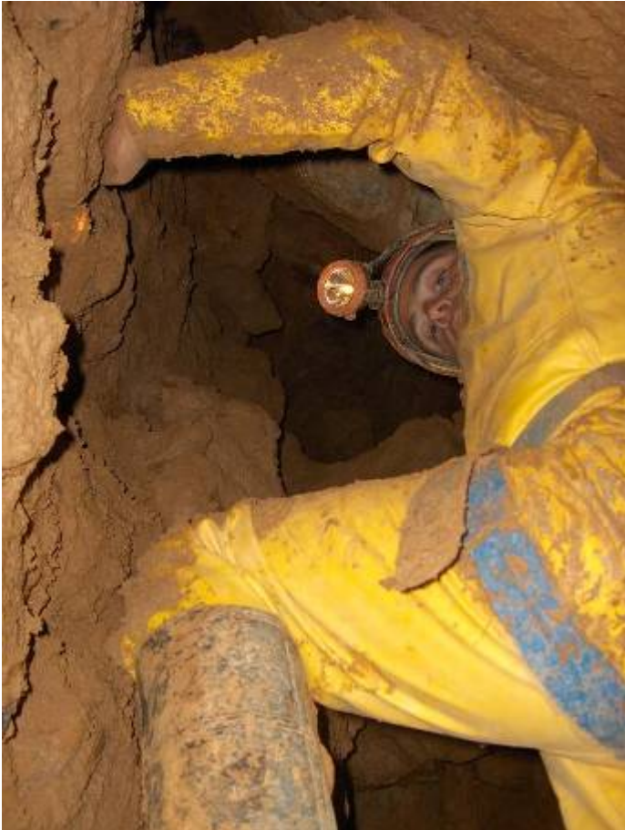
Peter beklimt een eerste cheminée

Dan komen de verlossende woorden. Dago kom ook maar af alles is veilig genoeg. Snel neem ik het tonnetje mee waarin het fototoestel zit en weg ben ik. Eerst een boyau van zo'n 7 meter de "Boyau Gardena" en daarna wordt het breder. Peter is net enkele treden aan het maken aan de cheminée en een beetje later staan we boven. Jos zit reeds een beetje verder en zo'n 2 meter hoger te wachten in het zaaltje. Langs rechts kan je op verschillende plaatsen naar beneden kijken en op enkele plaatsen kun je er enkele meters in afdalen maar alles loopt dicht op blokken.