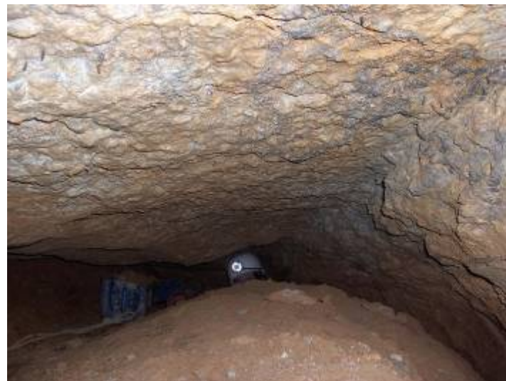
Jos aan het werk aan de terminus

Het is al een eind in de namiddag als we beslissen om de eigenlijke stop van de galerij aan te vallen. We waren voorheen ongeveer anderhalve meter voor het einde van gang naar beneden beginnen graven maar daar kregen we zicht op het vervolg van de meander en die ging toch richting eindstop. Dus konden we evengoed direct helemaal achteraan beginnen. Zo gezegd zo gedaan en na een uurtje of zo kan ik uiteindelijk aan de rood gekleurde (veel ijzer in het sediment) eindstop beginnen graven.