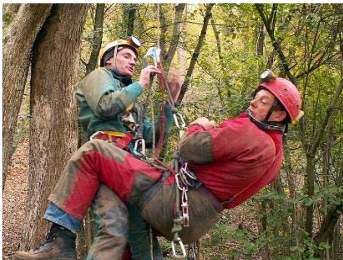
" déscastratie "