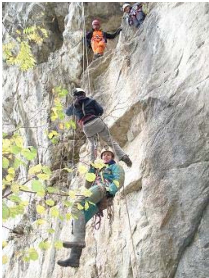
Veel volk aan de rotsen !

plaketten, clowns, assen, de ringen en brochen, en dan ook nog hele oude pitons of rotshaken. Daarna werd er uitgelegd waar je op moet letten als je een spit in de rots wilt kloppen en dan was het proberen maar! Er werd eerst voorzichtig begonnen maar naargelang we stilletjes aan een kokertje kregen werd er harder en harder gemept op het spit-handvat. Ik vond het een vrij vermoeiende bezigheid maar toch wel leuk.