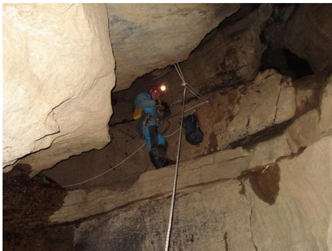
Eerwaarde "Van Dorpe" ziet dat het goed is.

met een nummer. Er moesten zes verschillende taken uitgevoerd worden. Maarten en ik mochten al meteen