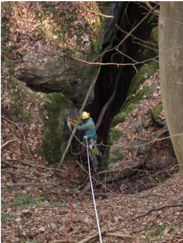
Maarten equipert hors-crue

Aan de grot aangekomen hebben we nog eerst een rustig kopje thee gedronken, nog wat van de eerste zonnestralen genoten en dan stilletjesaan onze zakken gekit. Onze eerst opdracht was een "hors crue" equiperen.