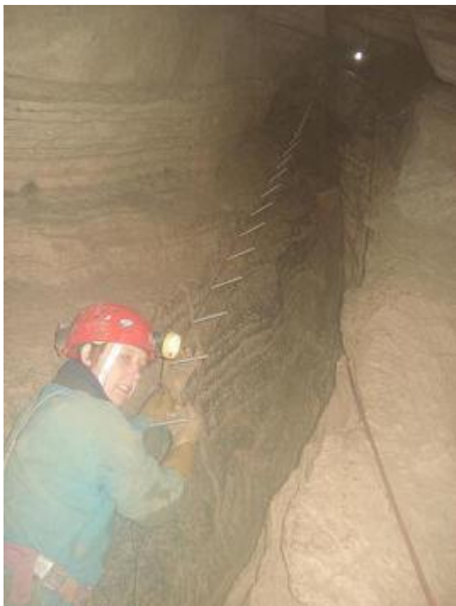
Mich in actie op een van de stellingen

met de castratie beginnen en tevens op hetzelfde touw een afdaling met zware last + knoop passeren.