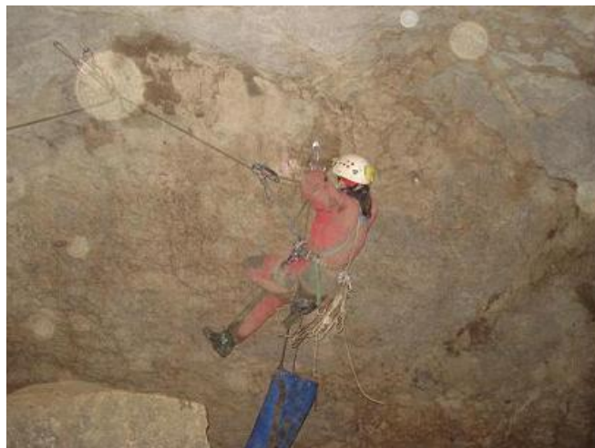
Sofie equipeert een traversée

Bij deze oefening moest ik me toch even goed concentreren zodat ik zeker geen veiligheidsfout zou maken. Beginnen met twee ankerpunten, mezelf goed beveiligen, de hele les ramde door mijn hoofd terwijl ik met de benen in het ijle probeerde om de volgende ankerpunten te plaatsen. Maar ook hier had ik het er goed vanaf gebracht en van Maarten hoorde ik ook geen klachten. Amaai, dat ging goed vandaag, als dat maar zo zou blijven duren!