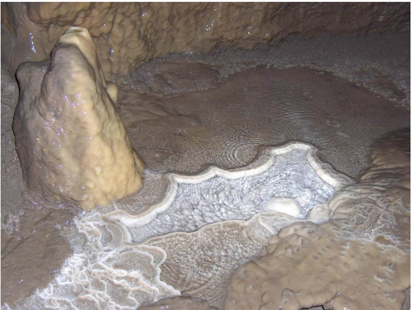
Een prachtig hoekje in de Grotte-mine de Vaux-sous-Olne