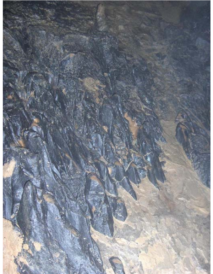
Bizarre zwarte gekleurde rots

Normaal zie je concreties van wit over bruin tot rood maar in dit deel van de grot zijn de concreties zwart, ja zwart. Ik had dat nog nooit gezien en bekijk dus alles in detail. Er zijn zwarte calcietformaties, zwarte kleiformaties, zwarte fossielen, van alles wat maar allemaal in het zwart. Eigenlijk gaat het hier over formaties die bedekt zijn met een fijn laagje zwart stof dat daarna op een of andere manier is verhard en blinkt alsof er een laagje vernis op zit. Even moeilijk om niet te besmeuren dan witte concreties.