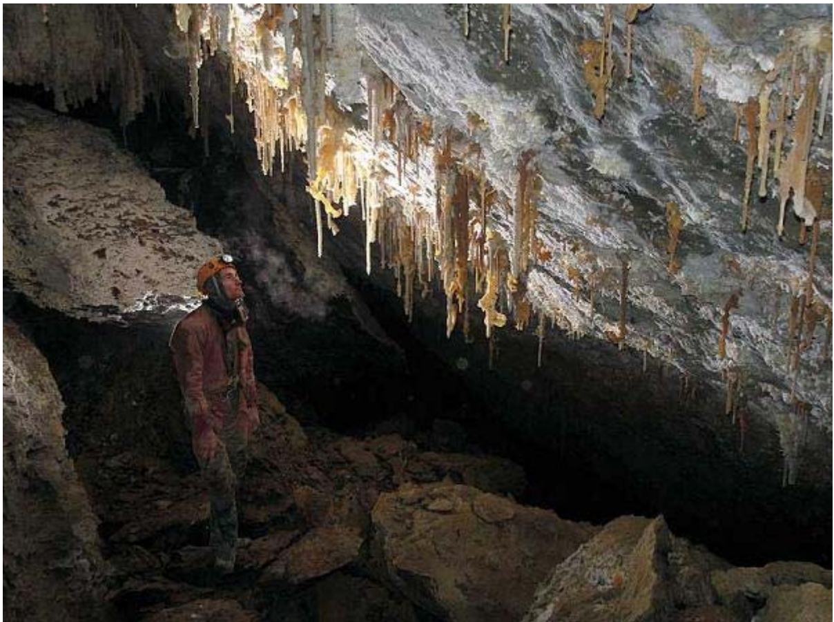
Yoko – Tsuno