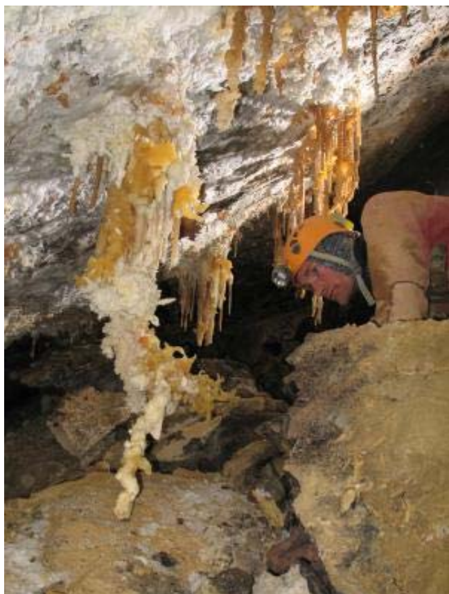
The fallen beauty

stranden en een stevige tocht in het gezicht: alle ingrediënten waren aanwezig voor een onvergetelijke première. Twee keer dienden we ons te bukken. Een zijrivier (Rivière Tournesol) werd even over 30 meter gevolgd (3x5m), ze liep door! Iedereen genoot met volle teugen, dit was geen alledaagse exploratie. Aan elk sprookje komt echter een einde, in dit geval was het geen echt einde maar wel een zeer lage route mouillante. De 20 cm lucht boven het 1m30 diepe water kon niemand bekoren, ondanks de frisse luchtstroom die ons in het gezicht blies. Dat was voor een volgende keer, met ponto of neopreen dan wel. Beide topoploegen blikten de Rivière Tintin op enkele uren tijd in: 721 m in één ruk!