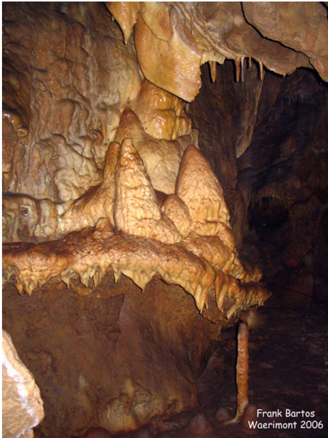
De BDW op zijn best

Omdat we niet kunnen wachten en omdat er nog andere mensen bij zijn rijden we verder.