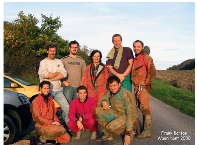
De bende van Cartouche