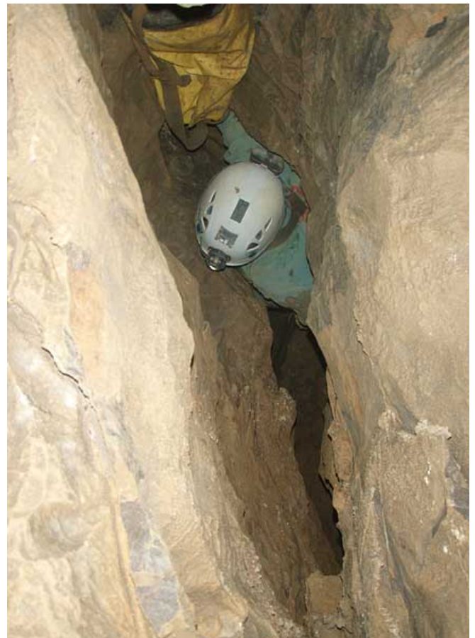
Op zijn Belgisch – De Daltons !!!