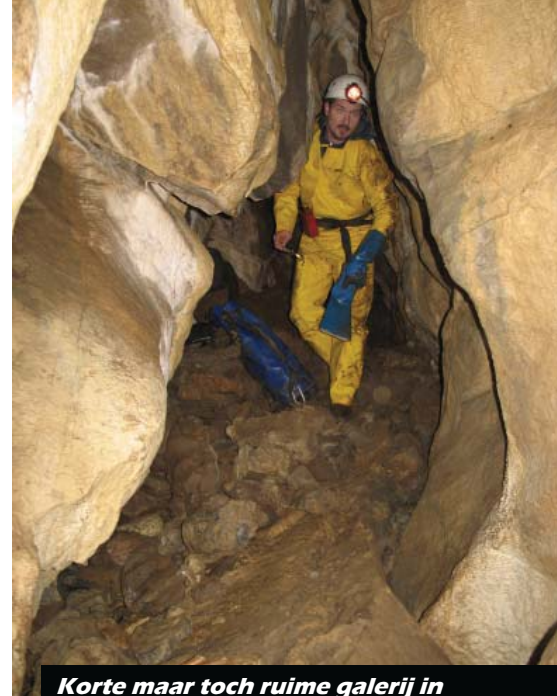
Korte maar toch ruime galerij in de Grotte des Saribots. (P. De Bie)