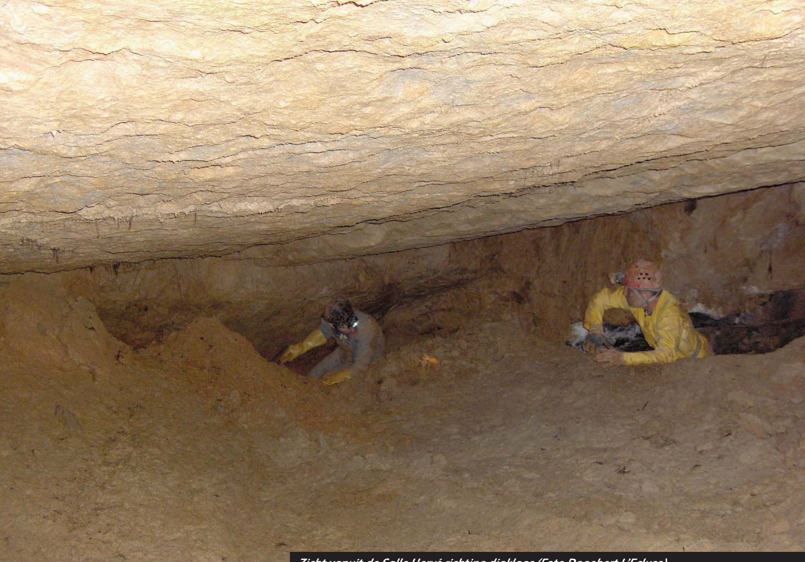
Zicht vanuit de Salle Hervé richting diaklaas