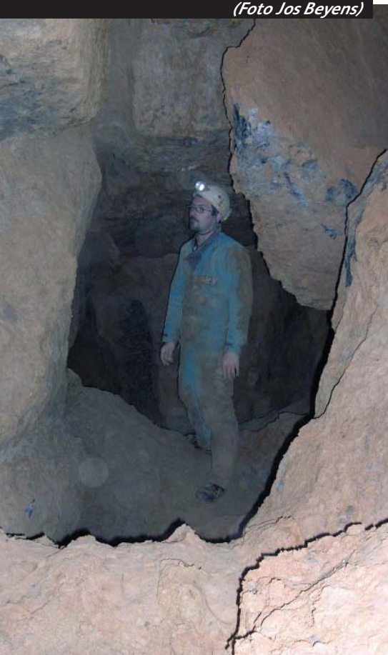
Op het einde van de Galerie Disto