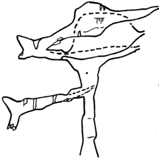
coupe O - E coupe réseau 2006