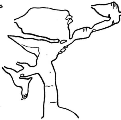
coupe N - S coupe réseau 2006