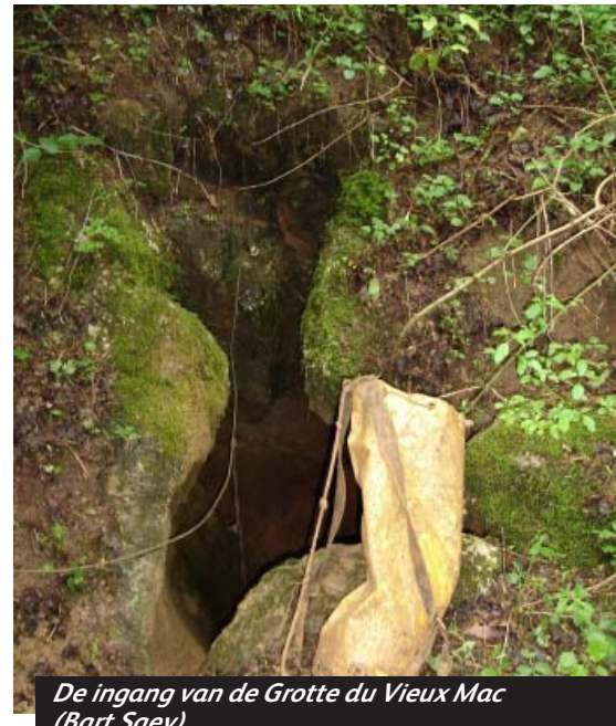
De ingang van de Grotte du Vieux Mac (Bart Saey)